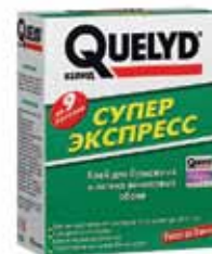
Quelyd Супер Экспресс